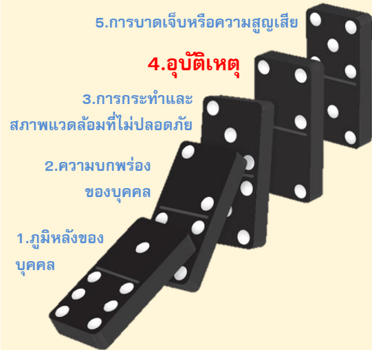
ทฤษฎีโดมิโน (Domino Theory)

ตามทฤษฎีโดมิโน (Domino Theory) หรือทฤษฎีการเกิดอุบัติเหตุของเฮนริช (H.W. Heinrich) กล่าวว่า หากโดมิโนตัวที่ 1 (สภาพแวดล้อมหรือภูมิหลังของบุคคล) ล้ม ย่อมส่งผลให้โดมิโนตัวถัดไปล้มตาม ดังนั้น หากไม่ยอมยกให้โดมิโนตัวที่ 4 (อุบัติเหตุ) ล้ม ก็ต้องเอาโดมิโนตัวที่ 3 (การกระทำหรือสภาพการณ์ที่ไม่ปลอดภัย) ออก นั่นหมายถึงต้องกำจัดสถานการณ์ที่ไม่ปลอดภัยทั้งไปนั่นเอง เพื่อหลีกเลี่ยงการบาดเจ็บหรือความเสียหายที่จะเกิดขึ้น เพราะฉะนั้น ถ้าหากผู้ขับขี่ได้มีการพัฒนาทักษะทั้ง 3 ด้าน (ความถูกต้องในการตอบสนอง ความไวในการตอบสนอง และการบังคับพวงมาลัย) ดังที่กล่าวมาแล้ว จะเป็น การลดสถานการณ์เสี่ยงที่อาจเกิดขึ้น ทำให้เป็นการลดโอกาสการเกิดอุบัติเหตุด้วยเช่นกัน